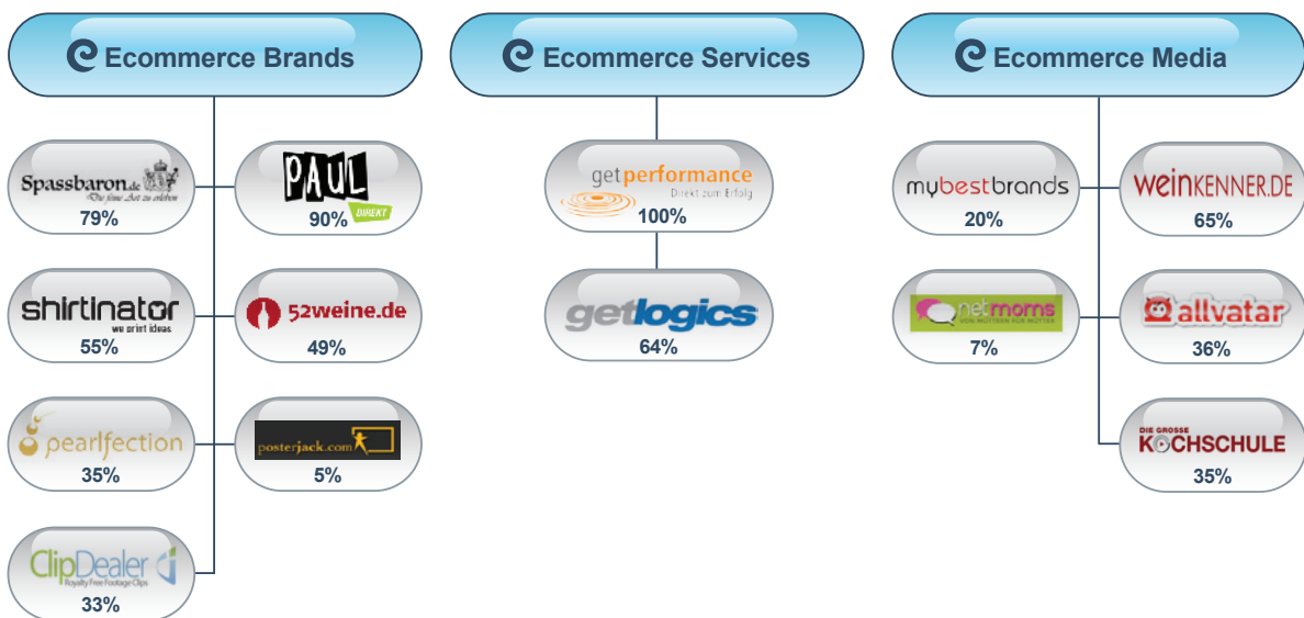
Abb.: Die Geschäftsfelder der Ecommerce Alliance-Ecommerce Brands, Ecommerce Services und Ecommerce Media (Stand 31.05.2011).

Und so steht die Ecommerce Alliance AG als E-Commerce-Gruppe für eine Strategie, die ihren Weg von Anfang bis Ende klar verfolgt, kontrolliert und umsetzt. Voller Kraft und voller Zuversicht. Mit guten Marken und guten Ideen. Und mit Ihnen, unseren Aktionären. Danke für Ihr Vertrauen!