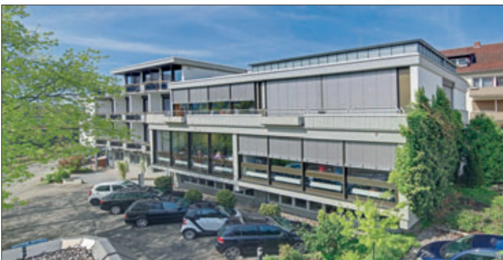
Bad Münster am Stein, Franz-Schubert-Str. 20 Limit € 350.000 · Erlös € 1.045.000

Aufgrund der robusten Verfassung des Immobilienmarktes, der anhaltend niedrigen Zinsen und der intensiven Bemühungen zur Akquisition neuer Auktionsobjekte gehen wir von stabilen Umsätzen aus und sind für den weiteren Verlauf des Jahres optimistisch.