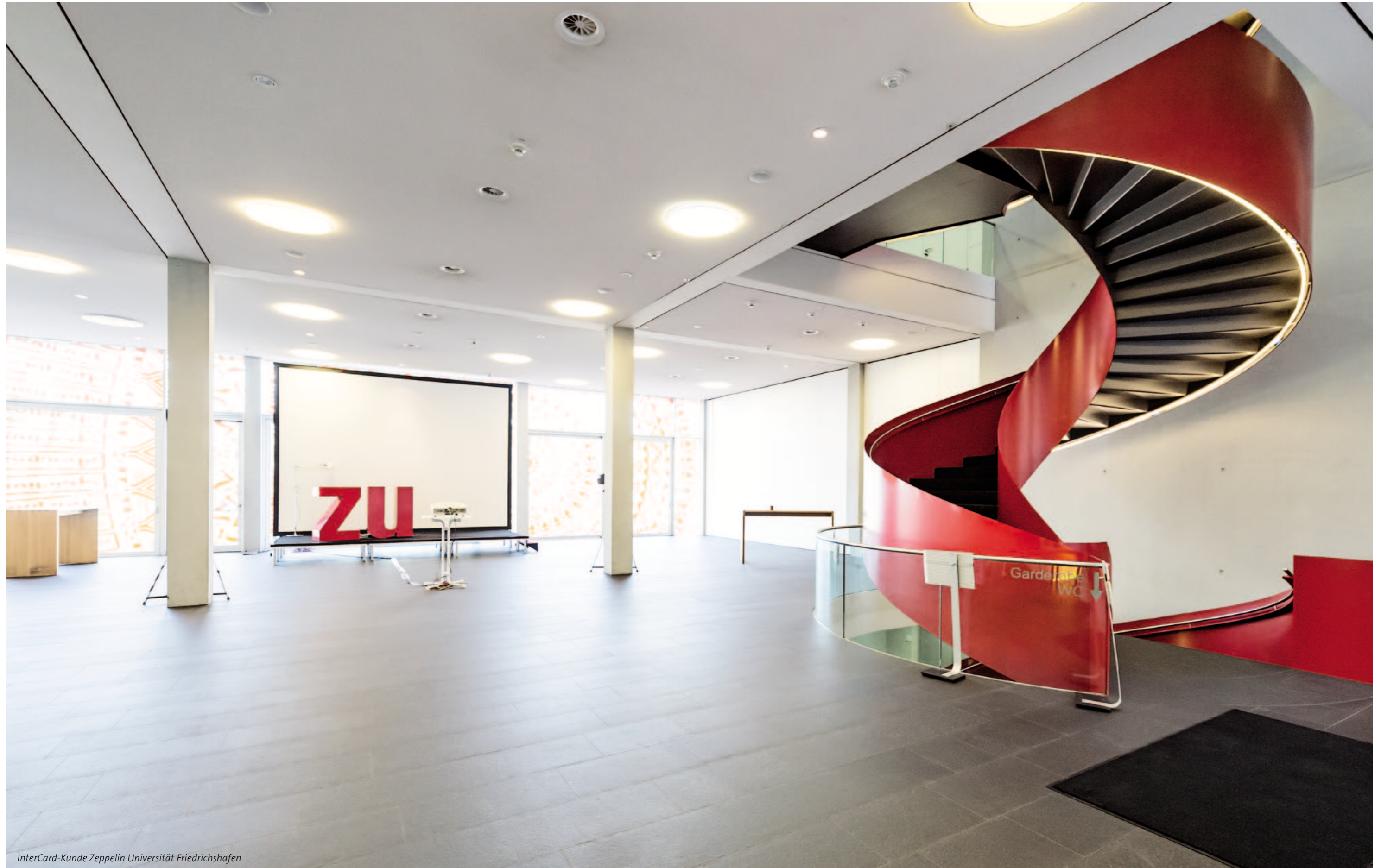
InterCard-Kunde Zeppelin Universität Friedrichshafen