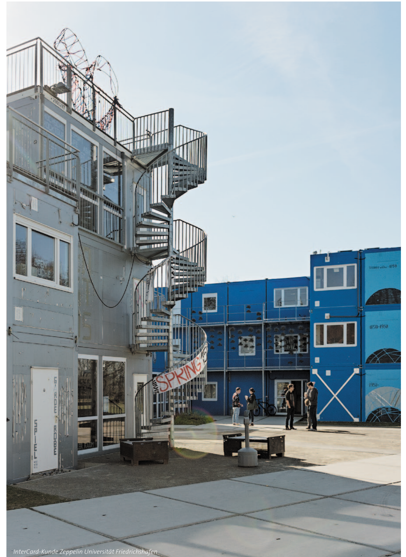
InterCard-Kunde Zeppelin Universität Friedrichshafen

Die Studierenden und Universitätsmitarbeiter bezahlen mit der Karte in der Mensa und Cafeteria, an Kopierern, Druckern, in der Bibliothek, an Verpflegungs-, Parkschein- und Waschautomaten. Der Elektronische Studierenden- und Mitarbeiterausweis regelt den Zugang zu Gebäuden, Räumen, Parkplätzen, Internetterminals und PC-Arbeitsplätzen.