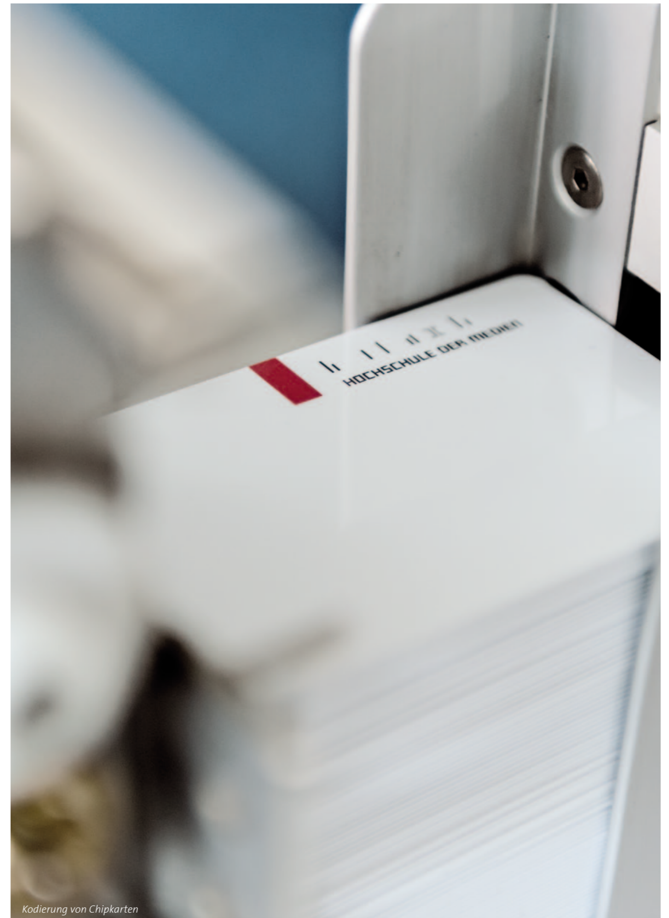
Kodierung von Chipkarten

Die Stadtwerke Augsburg setzen mit der Einführung eines konzernweiten Chipkarten-Systems von Multicard neue Maßstäbe. Erstmals bezieht ein Energieversorger in Deutschland bei einem CRM-Projekt den Öffentlichen Personennahverkehr auf Basis einer multifunktionalen Kundenkarte mit ein.