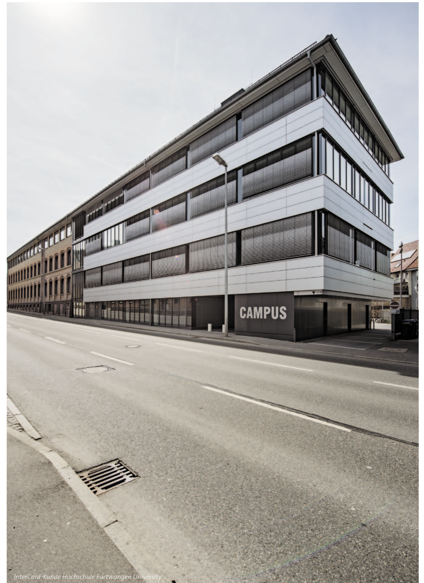
InterCard-Kunde Hochschule Furtwangen University