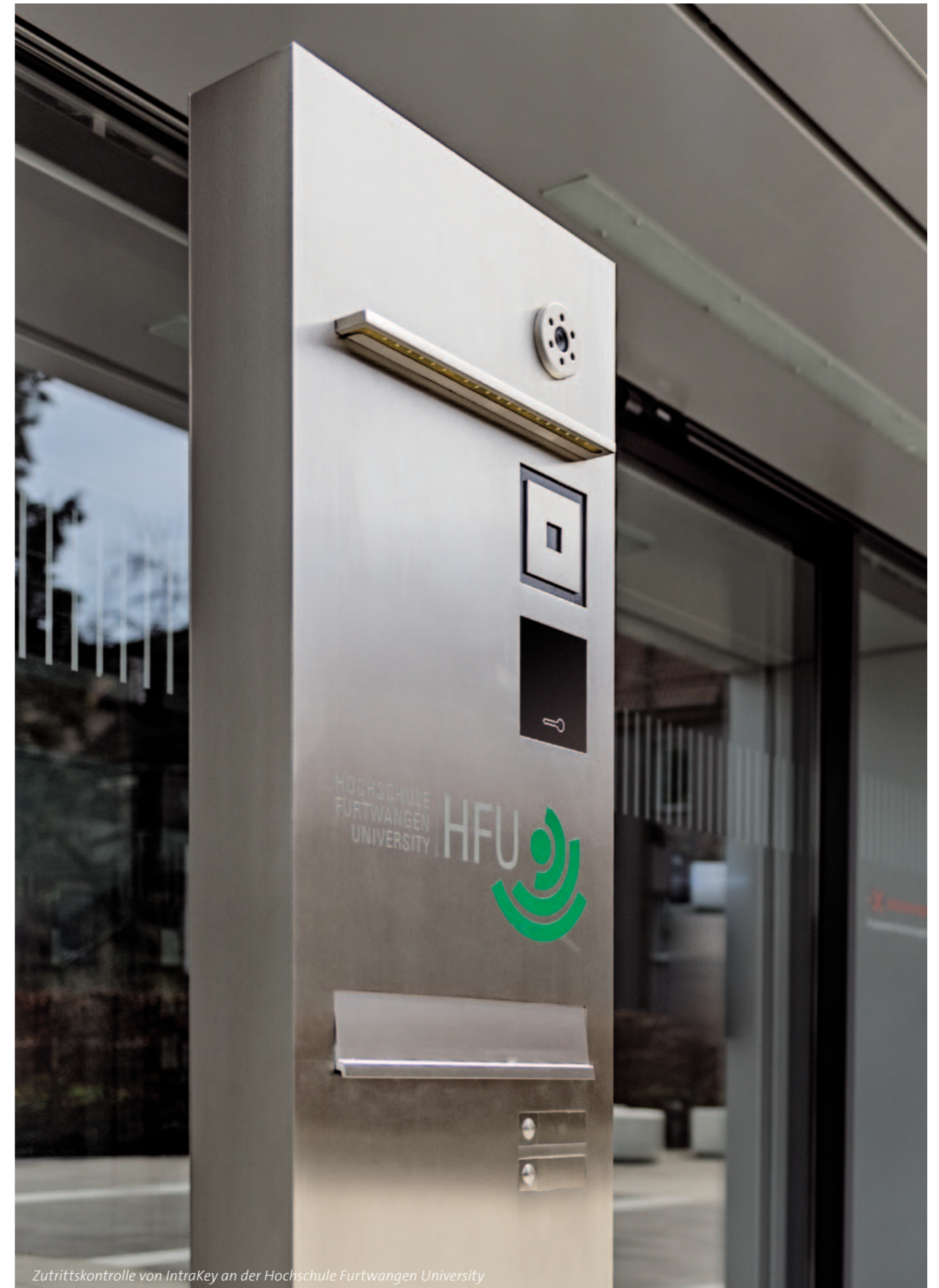
Zutrittskontrolle von IntraKey an der Hochschule Furtwangen University

Der Vertrieb von IntraKey wurde forciert. Die in den vergangenen Jahren neu gewonnenen Vertriebsmitarbeiter haben eine Intensivierung der Vertriebsaktivitäten ermöglicht. Im Jahr 2013 hat IntraKey zusätzlich zwei neue Außendienstmitarbeiter eingestellt und den Vertriebsinnendienst weiter gestärkt, woraus die im Jahr 2014 erzielten positiven Effekte resultieren.