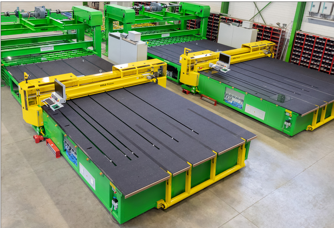
HEGLA ProLam für den automatisierten Hochleistungszuschnitt von Verbundsicherheitsglas

Der Cashflow aus Investitionstätigkeit wird mit - € 13,5 Mio. (Vj.: - € 3,8 Mio.) ausgewiesen und resultiert insbesondere aus den Investitionen in immaterielle Vermögens-