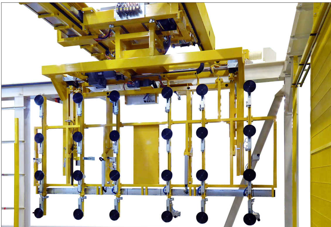
HEGLA-Gantry zum Auflegen und Abnehmen von Flachgläsern

Der LEWAG-Konzern versucht, Chancen frühzeitig zu erkennen und zu ergreifen, um den Unternehmenserfolg nachhaltig zu steigern. Dabei werden auch Risiken eingegangen, um Chancen bestmöglich nutzen zu können. Das Chancen- und Risikomanagement stellt sicher, dass die Geschäftstätigkeit in einem gut kontrollierten Unternehmensumfeld ausgeübt werden kann.