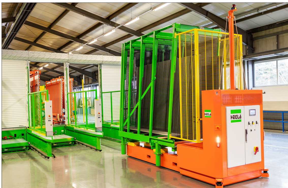
Fahrerlose Transportsysteme (AGV's) von HEGLA für den automatisierten Glastransport zwischen den Stationen im Flachglasbearbeitungsprozess

Laut VDMA ist im deutschen Maschinen- und Anlagenbau der Auftragseingang 2019 drastisch um 9 % gesunken, wobei die Inlands- und Auslandsnachfrage gleichermaßen von diesem Rückgang betroffen sind.