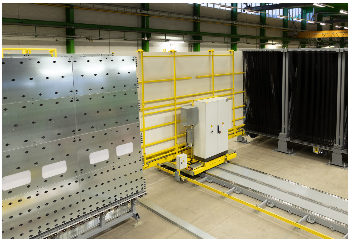
HEGLA-SortJet zur automatischen Sortierung der geschnittenen Glasscheiben und Online-Übergabe an die nächste Bearbeitungsstation, z. B. eine Isolierglaslinie

Der zunehmenden Abhängigkeit wesentlicher Geschäftsprozesse von IT-Anwendungen und der IT-Infrastruktur wird durch eine eigene IT-Organisation im LEWAG-/HEGLA-Konzern Rechnung getragen. Die Datensicherheit und -verfügbarkeit wird mittels redundanter Serverstrukturen gewährleistet. Den IT-Risiken wird mit geeigneten personellen, technischen und organisatorischen Maßnahmen begegnet. Das interne Kontrollsystem sieht