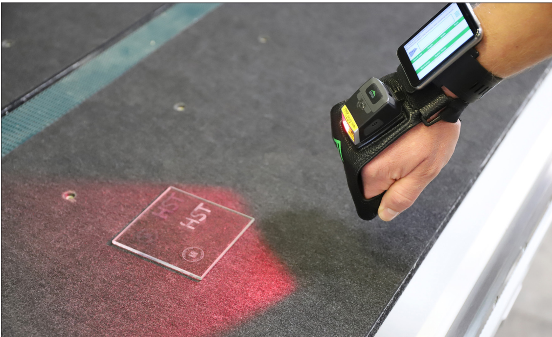
Neue Technologien: HEGLA New Technology entwickelte u. a. einen Handscanner zur Identifikation von Lasermarkierungen auf Glasscheiben.

Die Vermögenslage und die Kapitalstruktur im LEWAG-Konzern sind somit weiterhin als stabil zu bezeichnen.