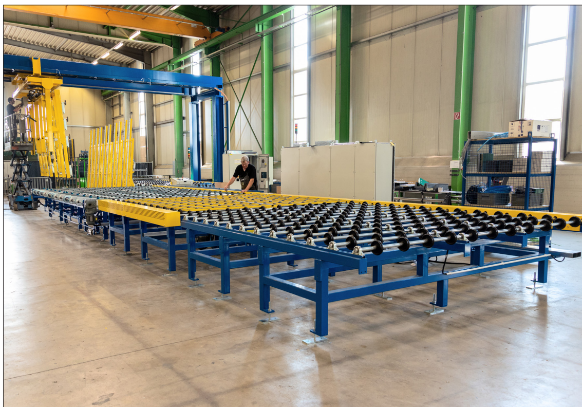
HEGLA Portalabstapler für den US-Markt

Zur Eindämmung der potenziellen Risiken aus der Corona-Pandemie wurden in allen Gruppenunternehmen Notfallszenarien entwickelt und umgesetzt, die die Auswirkungen auf Personal, Produktion sowie Vertrieb berücksichtigen.