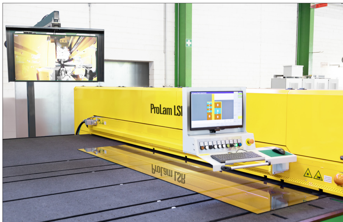
Die ProLam LSR von HEGLA erzielt mit der neuentwickelten Laserdioden-Heizung eine bis zu 20 % höhere Produktivität gemessen am Scheibendurchsatz.

Die inländische Bauwirtschaft hat hingegen der Covid-19-Krise bislang recht gut getrotzt und steht deutlich besser da als viele andere Wirtschaftszweige. Gegenläufig zum europäischen Trend nahmen die realen Bauinvestitionen 2020 um 1,9 % leicht zu (2019: + 3,8 %); im Wohnungsbau soll das Wachstum mit + 2,8 % noch etwas stärker ausgefallen sein (Quelle: Statistisches Bundesamt, Fachserie 18 Reihe 1.2: Volks-