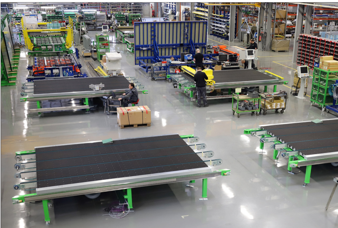
Serienfertigung der Schneidanlage RapidLine im HEGLA-Werk Beverungen. Die Fertigung erfolgt in Modulbauweise, das Customizing durch die entsprechende Auswahl der Optionen und die Vernetzung mit den vor- oder nachgelagerten Anlagen.

Bezogen auf die einzelnen Segmente des LEWAG-Konzerns zeigt sich die folgende Entwicklung: Im größten Segment „West“ wird – bei einem Umsatzanstieg von € 71,0 Mio. auf € 72,4 Mio. – ein EGT in Höhe von - € 2,7 Mio. ausgewiesen (incl. der o. g. Sondereffekte) nach + € 5,6 Mio. im Vorjahr. Im Segment „Ost“ verringerten sich die Umsatzerlöse von € 11,8 Mio. auf € 9,4 Mio., während sich das EGT zugleich von € 1,1 Mio. auf € 0,2 Mio. abschwächte. Im Segment „USA“ nahmen die Umsatzerlöse von € 36,6 Mio. auf € 35,1 Mio. ab; das EGT beläuft sich auf € 3,4 Mio. (Vorjahr: € 4,2 Mio.).